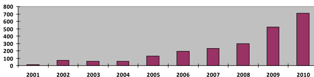
Gráfico 2. Víctimas mortales anuales entre las fuerzas de la coalición